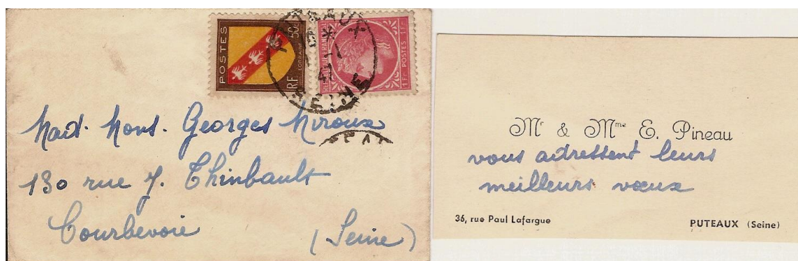
Tarif d'un jour le 1 er janvier 1947 avec sa carte