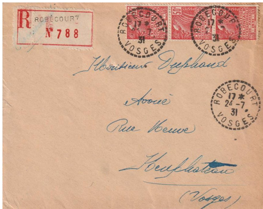
Lettre recommandé 1 er échelon avant juillet 1932 au tarif du 1/5/26 à 50c + 1fr soit 1fr50