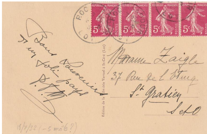
Carte Postale 5 mots au plus