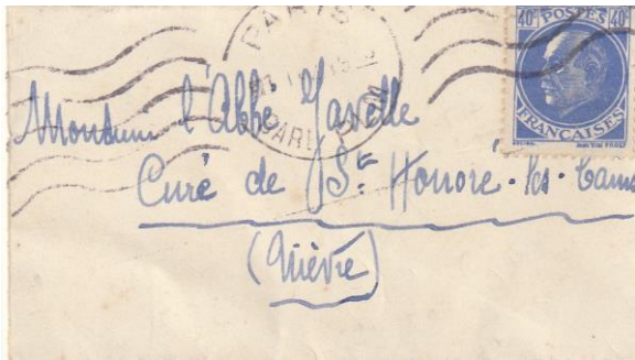
Carte de visite assimilée à imprimé 1 er échelon soit 40c.