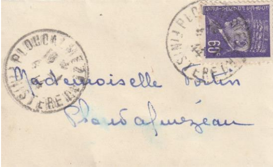
Carte de visite 5 mots de politesse soit 60c.