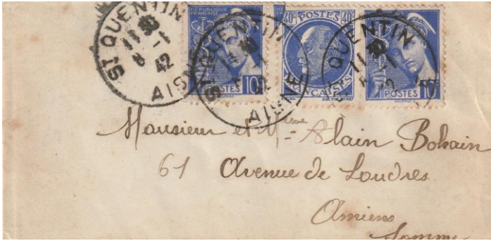
Carte de visite 5 mots de politesse soit 60c. le 4 ème jour